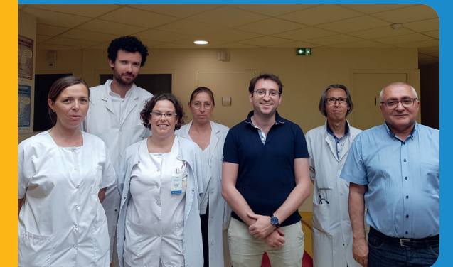
Équipe neuromusculaire adulte.