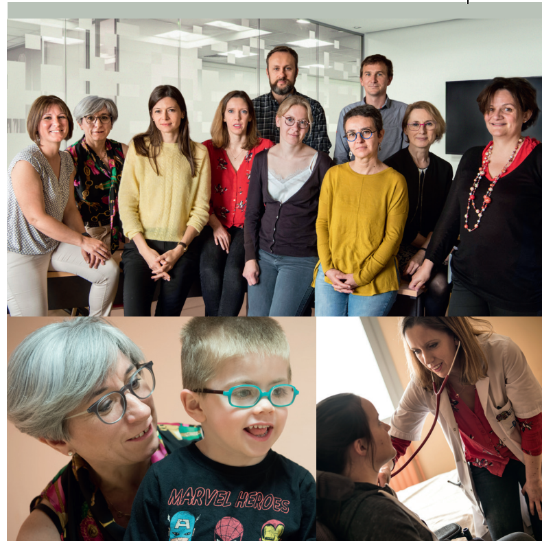
Équipe neuromusculaire pédiatrique.

Le Centre de Référence Maladies Neuromusculaires de Brest (CRMNM) a été labellisé en 2017 dans le cadre du plan national maladies rares. Il est rattaché au Centre de Référence des Maladies Neuromusculaires Atlantique Occitanie Caraïbes. Il dépend de la Filière Filnemus (Filières Maladies Rares).